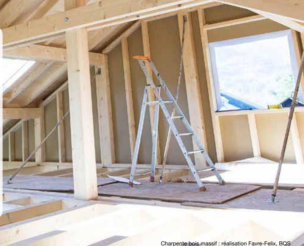
Charpente bois massif : réalisation Favre-Felix, BQS